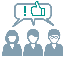
Informieren und begeistern