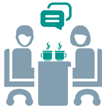
Unternehmenskultur auf dem Prüfstand – im Dialog mit den Beschäftigten

Jedes Unternehmen bzw. jede Institution ist anders – daher sind auch die Maßnahmen für eine chancengleichheitsfördernde und diskriminierungsvermeidende Unternehmenskultur bzw. Personalentwicklung vielfältig. Voraussetzung für eine erfolgreiche Umsetzung von Maßnahmen ist, dass diese sich leicht in den Betriebsalltag integrieren lassen.